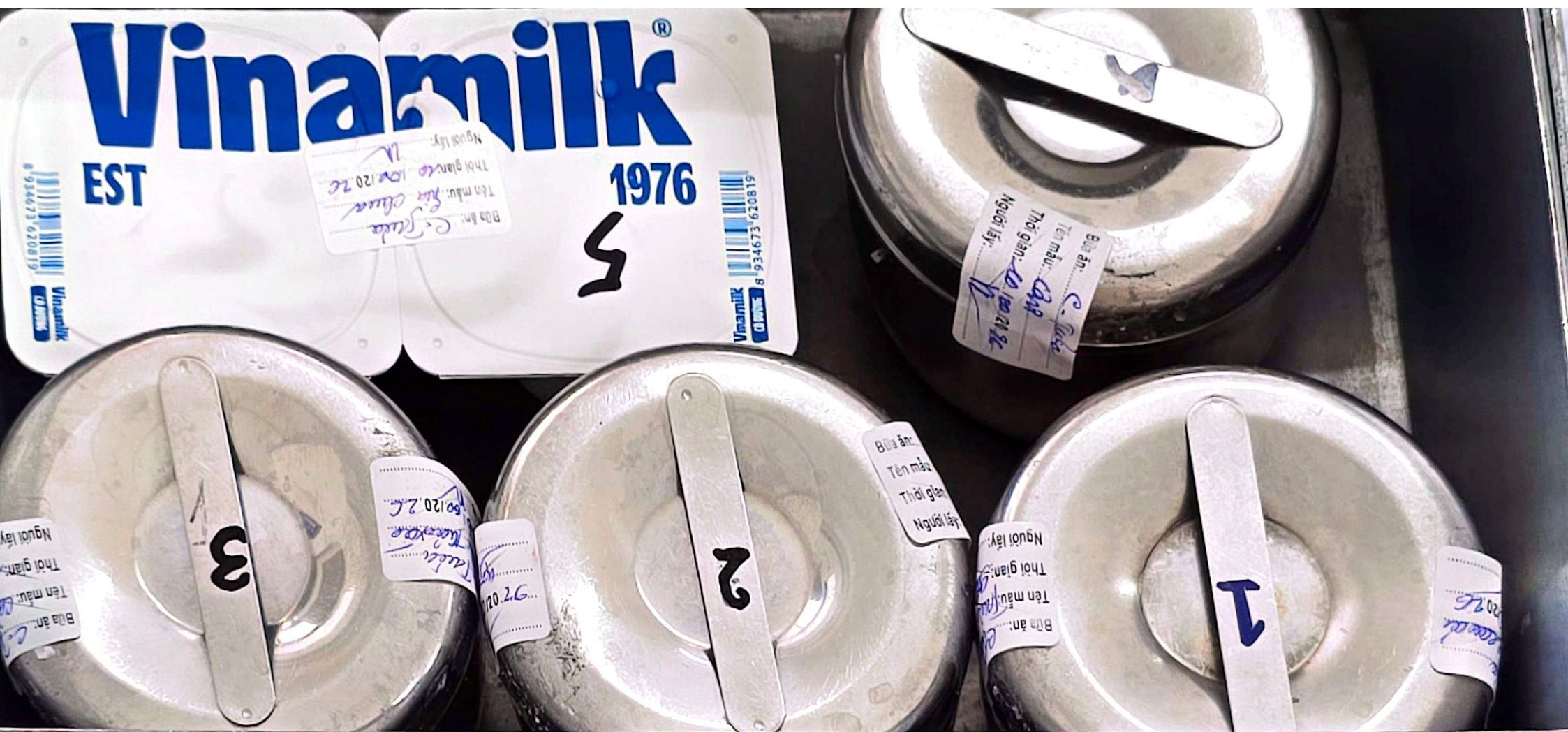
Được quét bằng CamScanner